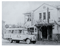
北海道勤労信用組合 (道立札幌労働会館2F)