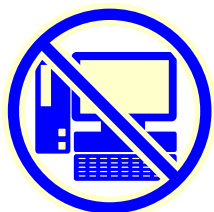
パソコン ゲーム機