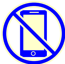
携帯電話 スマートフォン