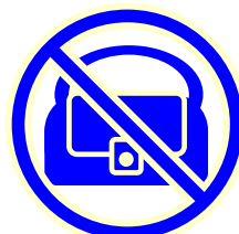
ハンドバッグの 留め具