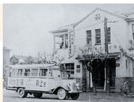
北海道勤労信用組合 (通立札幌労働会館2F)